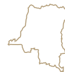
FIG 1 Ivoire Lega FIG 2 Epingle à cheveux Hungaana