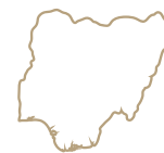
FIG 1 Masque Idoma FIG 2 Statue Mumuye